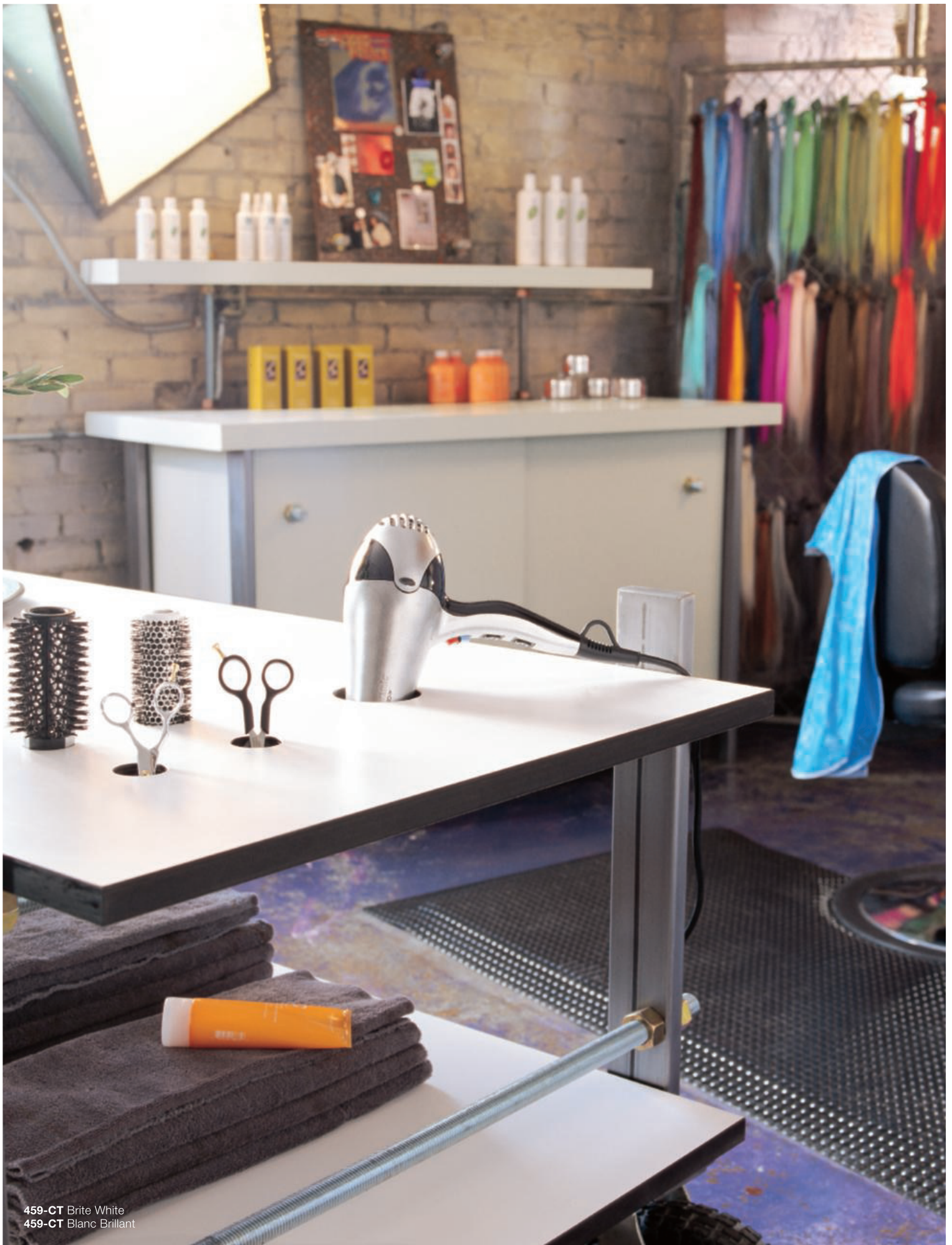
459-CT Brite White 459-CT Blanc Brillant